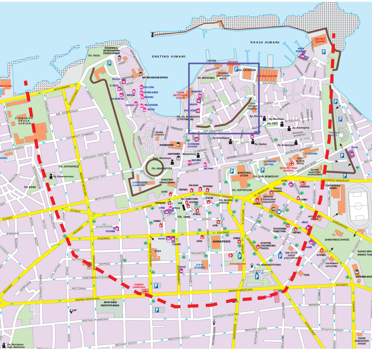
Χάρτης 1. Με κόκκινη γραμμή σημειώνονται τα όρια της πόλης των προχριστιανικών χρόνων. Τα όρια έχουν προσδιοριστεί από τους τάφους που ανακαλύφθηκαν στην περιοχή, οι οποίοι κατά τη συνήθεια της εποχής βρίσκονταν εκτός αλλά και στα όρια των πόλεων. Το εσωτερικό τείχος της πόλης (μπλε πλαίσιο) περικλείει την περιοχή που χρησίμευε ως ακρόπολη ή και ως χώρος κατοίκησης. Η ύπαρξη εξωτερικού τείχους δεν έχει επιβεβαιωθεί.