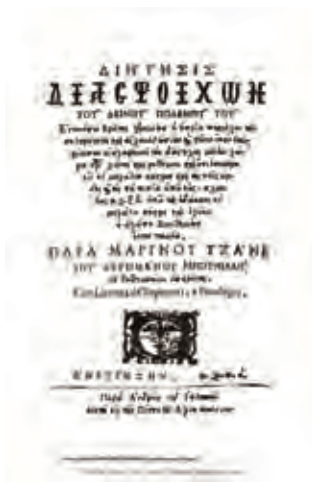
Αριστερά σύγχρονη έκδοση του έργου του Μαρίνου Τζάνε και δεξιά η πρώτη σελίδα από την πρωτότυπη έκδοση του 1681.

Το έργο του, που εκδόθηκε το 1681, γράφτηκε κατά την παραμονή του συγγραφέα στη Βενετία και πέρα από τις προσωπικές του εμπειρίες, πολλές πληροφορίες συλλέχθηκαν από τους φυγάδες Κρητικούς που μετά την κατάληψη του νησιού από τους Τούρκους, κατέφυγαν στην Βενετία. Εν συντομία το έργο του ονομάστηκε Κρητικός πόλεμος, ονομασία που έχει καθιερωθεί για όλες τις εκδόσεις που αναφέρονται στα παραγμένα αυτά χρόνια της σύγκρουσης των Ενετών με τους Τούρκους από το 1645 που κατελήφθησαν τα Χανιά, μέχρι το 1669 που παραδόθηκε το Ηράκλειο. Το ποίημα αποτελείται από 12.000 στίχους στους οποίους, εκτός των γεγονότων της Κρήτης, περιγράφονται και άλλα γεγονότα του Ε' Βενετοτουρκικού πολέμου.