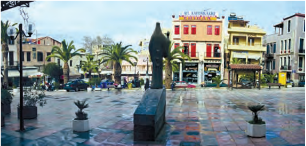
Ο ανδριάντας του πατριάρχη Αθηναγόρα, που δεσπόζει στην ομώνυμη πλατεία.

Η πλατεία Αθηναγόρα έχει διαμορφωθεί σε μια μεγάλη και ανοιχτή πλατεία από τις διάφορες πολεοδομικές επεμβάσεις που έγιναν στον χώρο τον 20ό αι., και περιβάλλεται από ενδιαφέροντα αξιοθέατα. Στην ανατολική πλευρά της πλατείας βρίσκεται η εκκλησία των Εισοδίων της Θεοτόκου . Ονομάζεται Τριμάρτυρη καθώς το μεσαίο κλίτος έχει καθαγιαστεί στα Εισόδια της Θεοτόκου, το βόρειο κλίτος (προς το λιμάνι) στη μνήμη του Αγίου Νικολάου και το νότιο στη μνήμη των Τριών Ιεραρχών.