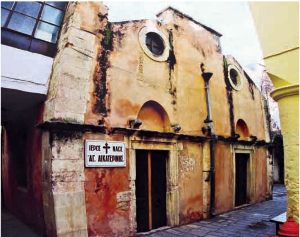
Ο ναός της Αγίας Αικατερίνης στη Σπλάντζια

Το τμήμα αυτό της Σπλάντζιας είναι εξίσου ενδιαφέρον καθώς κινείται σε παλιό τμήμα της πόλης. Ο υπαίθριος χώρος που συναντάτε φεύγοντας από τον Άγιο Νικόλαο υπήρξε τμήμα της ενετικής μονής και λειτουργούσε ως νεκροταφείο των επιφανών Ενετών. Ο χώρος εξακολούθησε να έχει την ίδια λειτουργία και κατά τη διάρκεια της τουρκοκρατίας. Αφού διασχίσετε τα γραφικά σοκάκια φτάνετε στην πύλη της Άμμου (δείτε περιγραφή στην αρχή της διαδρομής) και επιστρέφετε στον χώρο στάθμευσης.